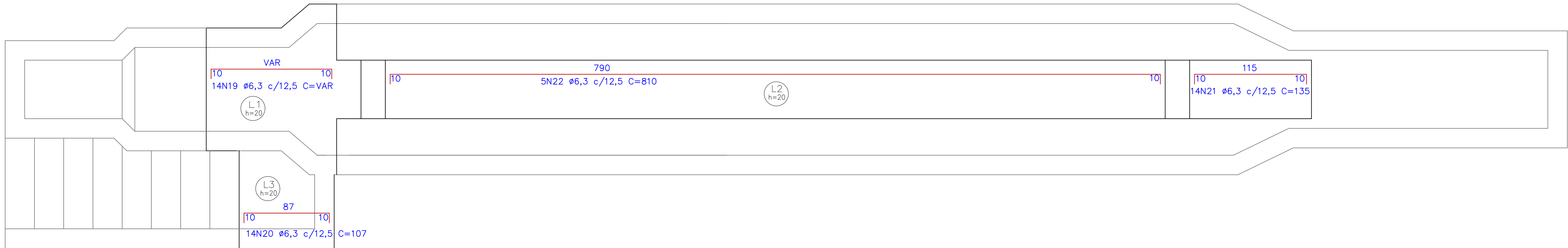
2 LAJE INTERMEDIÁRIA - ARMADURA LONGITUDINAL SUPERIOR ESCALA 1:25